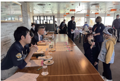
審査員からのコメント