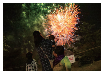
鹿沼 72 花火