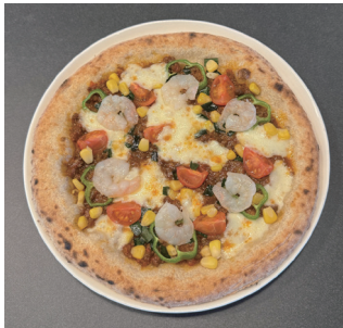
【たいようさんさんピザ】 低学年の部優勝 須田ちひろさん かぬま和牛 100% ポロネーゼ、えび、ミニトマト・コーン、ピーマン、鹿沼産ニラ、モッツアレラチーズ

2025 年 2 月 8 日に鹿沼市教育委員会後援で開催された、「第 1 回鹿沼キッズピッツァコンテスト」の鹿沼 72 賞に入賞したピッツァをチャリティーメニューとして 2/22 ～ 5/18 の間に計 287 食販売し、その売り上げの一部をチャリティー基金として鹿沼市の公益財団法人古澤育英会へ寄付いたしました。