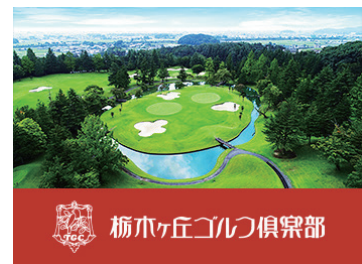
栃木ヶ丘ゴルフ倶楽部

周囲を見渡すとどこまでも広がる関東沃野のパノラマビューがご覧いただけます。コースは変化に富んだ個性的な 45 ホールが待ち受けます。