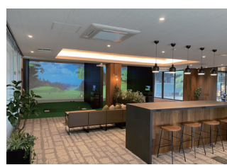
バーチャルゴルフ