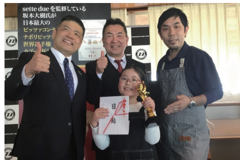
2025 年入賞者 記念撮影