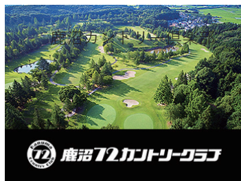
鹿沼 72 カントリークラブ

開場から 50 年以上経つ歴史あるゴルフ場で、45 ホールを有しています。ゴルフ漫画「風の大地」の舞台にもなっています。