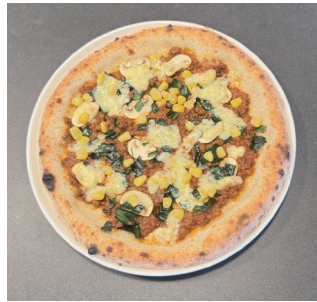
【鹿沼市ピッツァ】 高学年の部優勝 松崎涼太さん かぬま和牛 100% ポロネーゼ、鹿沼産ニラ、マッシュルーム、コーン、ナチュラルチーズ