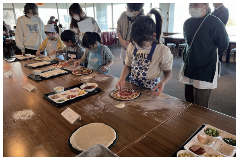
2025 年コンテストの様子

最優秀賞と鹿沼 72 賞に入賞したピッツァは、後日クラブ内レストランにてチャリティーメニューとして販売し、売上は地域支援のために活用いたします。さらに、入賞者には 2026 年 5 月に開催される人気イベント「鹿沼 72CC 花火大会」へのご招待を予定しております。子どもたちが楽しみ、地域とつながり、未来の可能性を広げることのできるイベントとなっております。