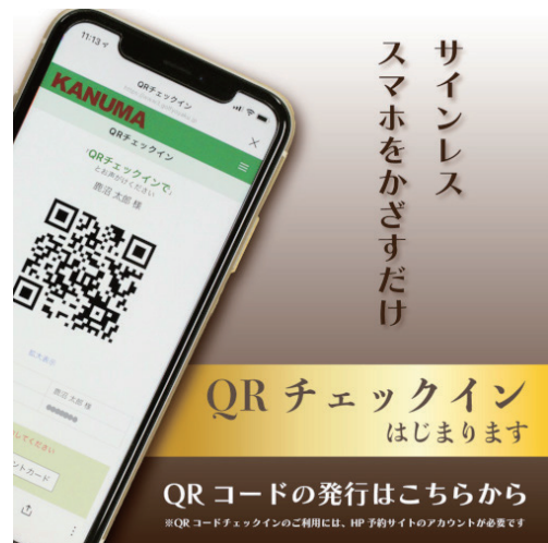
QRチェックイン画面