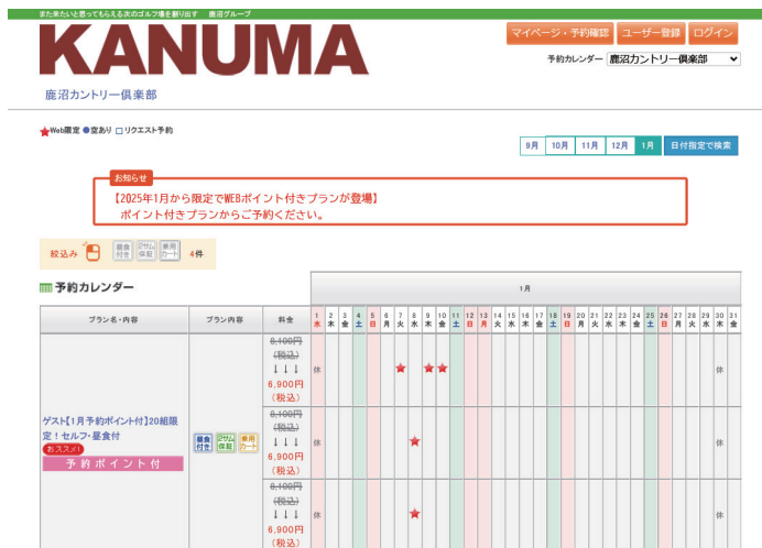
鹿沼グループ予約システム専用ページ

本取り組みは、鹿沼グループのビジョン“また来たい思ってもらえるゴルフ場を創り出す”実現の取り組みの一環として、ゴルファーの方々に、さらなる利便性とお得なサービスを提供いたします。これからもよりゴルフを身近に感じていただけるよう、鹿沼グループから情報発信を行うプラットフォームとして活用していくことを目指しています。