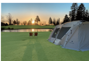
CAMPING & GOLF AT TGC

鹿沼グループが運営する 3 つのゴルフ場の中で「食」をテーマに様々な企画を実施しており、テラス席で地域の食材をメインに使用したディナーコースが堪能できる「星月夜テラスディナー」や、「CAMPING & GOLF AT TGC」のディナーでもコース料理が楽しめます。ランチも豊富で、プレーをされない方でもご利用可能。数多くのワインを取り揃えております。