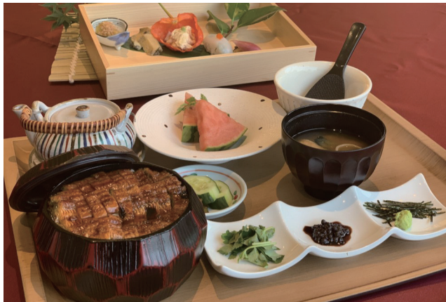
1周年限定メニュー 国産鰻のひつまぶし膳

鰻は仕上げに炭火を使いじっくりと焼き上げていて、ふっくらと香ばしく、とろっと濃いめの甘いタレを使用しています。♨は、自家製和だしを使用した出汁茶漬けを楽しむことができ、ワインペアリングやオプションのプライベート花火で贅沢な気分を味わえます。ゴルフプレーをしない方でもご予約可能です。