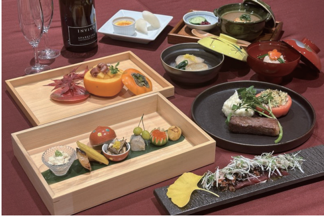
星コース 10,000 円 全7品 / 木箱前菜、お椀、お造り、煮物、とちぎ和牛、食事、デザート

また、ワインペアリングセットがオススメで、地元栃木県足利市にあるココファームのワインは 100% 日本のブドウを使用していて、生産者が心を込めて作り上げています。星コース料理にピッタリ合うワインをペアリングして提供しています。