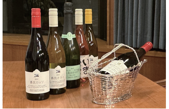
足利ココファーム ワインペアリング (4種) 3,300 円