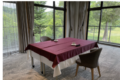
チェックインルーム