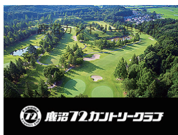
鹿沼72カントリークラブ

開場から50年以上経つ歴史あるゴルフ場で、45ホールを有しています。ゴルフ漫画「風の大地」の舞台にもなっています。