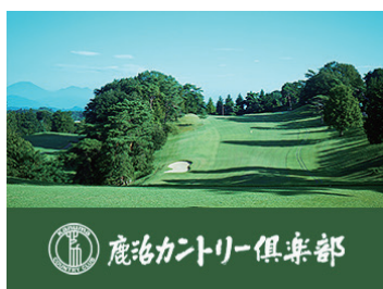
鹿沼カントリー倶楽部

開場から50年以上経つ歴史あるゴルフ場で、45ホールを有しています。ゴルフ漫画「風の大地」の舞台にもなっています。