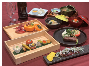
星月夜ディナー 星コース

鹿沼グループが運営する3つのゴルフ場の中で「食」をテーマに様々な企画を実施しており、テラス席で地域の食材をメインに使用したディナーコースが堪能できる「星月夜テラスディナー」や、「CAMPING & GOLF AT TGC」のディナーでもコース料理が楽しめます。ランチも豊富で、プレーをされない方でもご利用可能。数多くのワインを取り揃えており、年会費無料で登録できる「WINE CLUB」を開始しました。