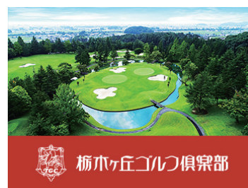
栃木ヶ丘ゴルフ倶楽部

周囲を見渡すとどこまでも広がる関東沃野のパノラマビューがご覧いただけます。コースは変化に富んだ個性的な45ホールが待ち受けます。