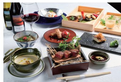
フルコースディナー