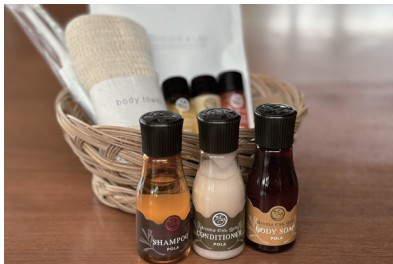
アメニティセット

専用のアメニティセット（シャンプー、コンディショナー、トリートメント、ボディソープ、歯磨きセット、コットン）をご用意。