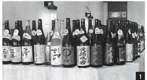
1 迫力満点の焼酎ボトル群 2 チーズクラッカーや地元「明宝ハム」など、焼酎が進むおつまみを20種類揃える