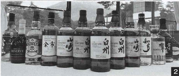
1 棚にギュウギュウに詰められたキープボトル。地元・山梨県北杜市で作られる「白州」が人気だ 2 国産高級酒がずらり 3 人気の飲み方はハイボール。「とりあえず生(ビール)」ならぬ「とりあえずハイボール」の注文も多いという