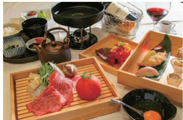
とちぎ和牛トマトすき焼き膳 6,500 円 (税込)

星月夜テラスディナーでは、ゴルフ場の自然の中で様々な体験が出来ます。日頃入ることの出来ないゴルフ場のフェアウェイをゆっくりウォーキングをしたり、雄大な緑あふれる自然の中でヨガや軽い運動も可能です。今後は散策できる移動型のツールを導入して、ディナー前に楽しんで頂く予定です。また、ディナーの前にテラスに設置しているソファ席でゆっくりワインやドリンク、そして音楽を楽しみながらディナー開始までをお楽しみ頂けます。オプションでプライベート花火 (40,000 円～) を打ち上げることもできるので、特別な時間をお過ごし頂けます。