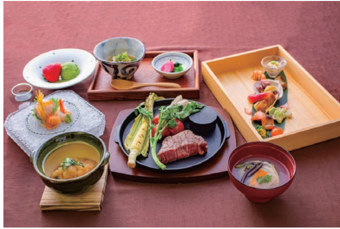
星コース 10,000 円 (税込) * 季節、仕入れ状況で料理内容変更有

ディナーは 4 種類ご用意しています。栃木ヶ丘イチオシのコースは星コース 10,000 円です。