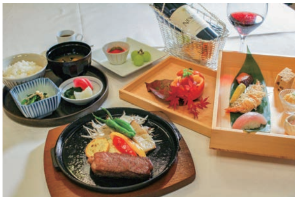
ステーキ膳 6,500 円 (税込)

また、その他のディナーとして、ステーキ膳やとちぎ和牛トマトすき焼き膳各 6,500 円を用意しました。