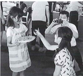
鹿沼グループ公式YouTubeチャンネル「ももごる」でも、子どもたちのピッツア作りの動画をアップ

ら、鹿沼市教育委員会の後援を得ることができたという。そして、このイベントのチラシを市内小学校の児童全員に配布し、その2日後には募集定員に達したとしている。 同CCでは、ピッツアの体験教室を事業化する意向で、7月24日から8月29日まで(8月1日除く)の間、「ピッツアを作る!体験教室」を行う。予約制で1人1980円(ピッツア1枚、1ドリンク付き)。これは誰でも参加できるので、ピッツア作りに興味があればこの機会にぜひ。