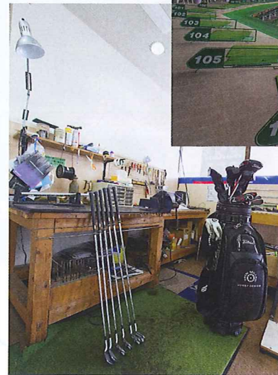
クラブハウスには工房があり、プロも信頼を寄せる職人が常駐。クラブの悩みはお気軽に相談を